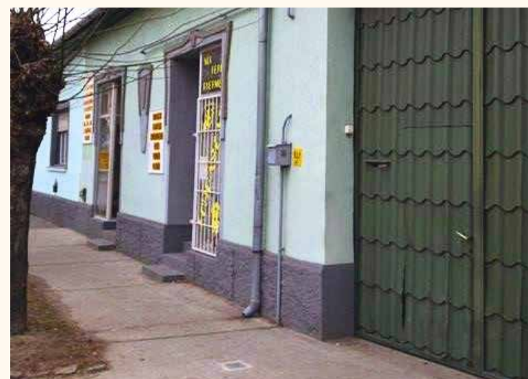
Ebben a Szentháromság utcai házban élt a család