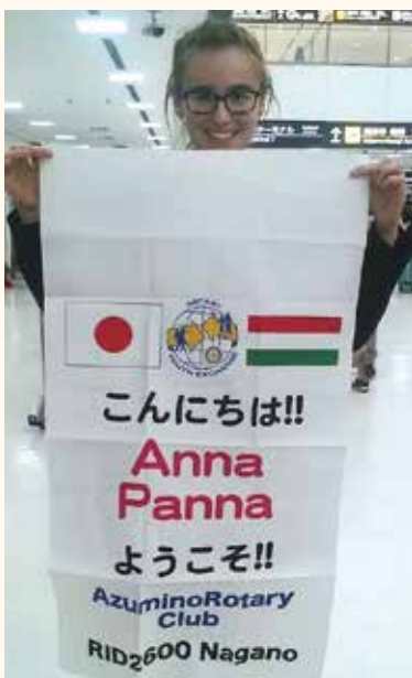
Kár volt izgulni a fogadtatás miatt