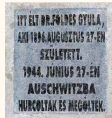
Botlatókő a Szentháromság u. 7. előtt