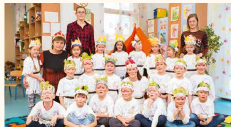
A vegyes csoportban indiánok tanyáztak a felépített sátorban