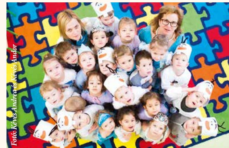
A kiscsoportos leányok Elza hercegnőnek, a fiúk hőembereknek öltöztek