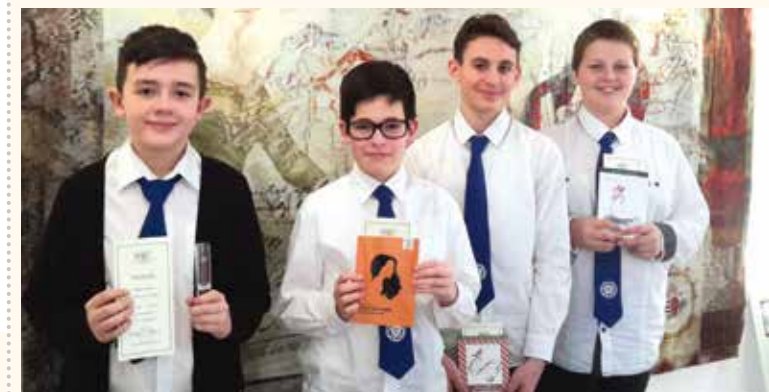
Az eredményhirdetés egy kis vendéglátással és beszélgetéssel zárult

Már 26. éve rendez meg a Petőfi gimnázium matematika munkaközössége a háromfordulós feladatmegoldó versenyt. Az első és második forduló levelezős formában, a harmadikat pedig a gimnázium épületében bonyolították le. A szervezők célja az volt, hogy viszonylag egyszerűbb feladatsorokkal népszerűsítsék a matematikát. Úgy állították össze a feladatsorokat, hogy a diákok önállóan is sikeresen meg tudják oldani.