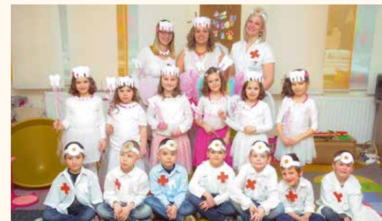
A nagycsoportos lányok fogtündér ruhában, a fiúk fogorvosi köpenyben perdtültek táncra