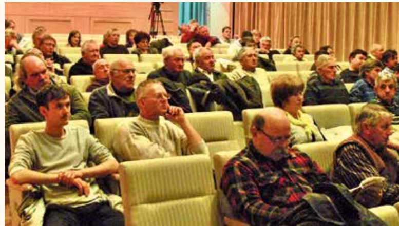
Idén sok gazda kísérté figyelemmel az előadásokat