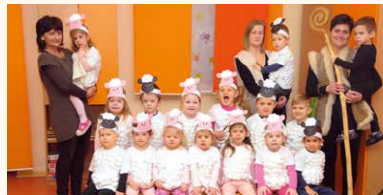
Az idei évben a mini csoportosok kisbárányok – az óvó nénik a juhász jelmezét öltötték magukra