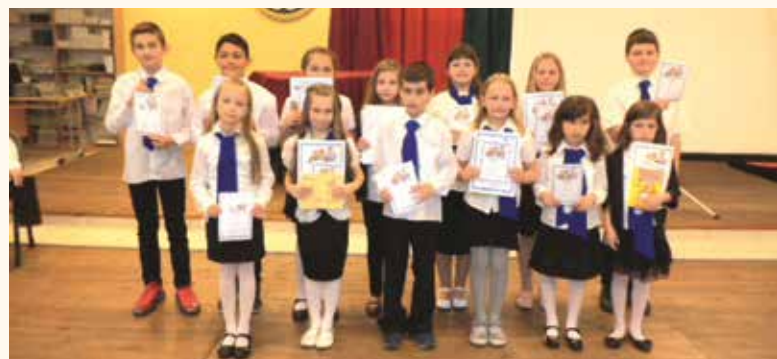
A prózamondó verseny résztvevői