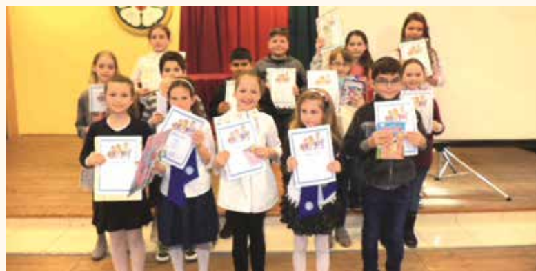
A rajzverseny díjazottjai