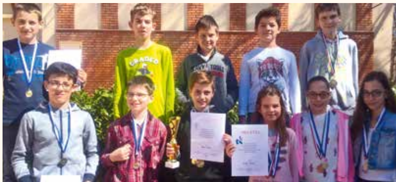
A sakk sakkör alsós és felsős versenyzői

A kronológiai sorrend szerint, az idei megmérettetés a Diákolimpia, megyei egyéni döntőjével kezdődött február 18-án a Városi Sportcsarnokban. 24 különböző intézmény (általános iskolától gimnáziumokig) mintegy 130 tanulója érkezett a rendezvényre.