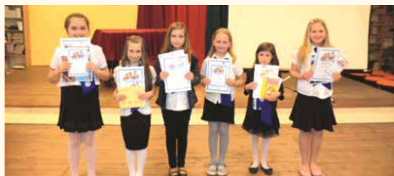
A prózamondó verseny különdíjasai