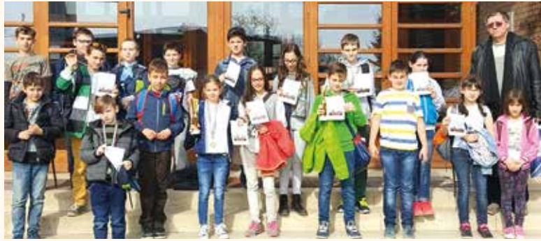
Márciusban Aszódon remekeltek sakkozóink

Diákolimpiai csapatdöntő, március 11., Kecskemét, Arany János Általános Iskola Iskolánk a lehetséges négy csoport mindegyikében képviseltette magát összesen hat csapattal indulva. Ezen a napon is a legtöbb érmet mi szereztük (1 arany, 4 ezüst) – felsős fiúcsapatunk veretlenül országos döntőbe jutott. A