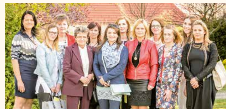
Az evangélikus ovi kollektívája és az alapokat nyújtó édesanya

„ikonikus” – plakett tulajdonosának lenni. A díjra úgy tekintek, mint a 26 éve eredményesen működő egyházi óvodánk elismerésére. Dija ez a benne élőknek és munkálkodóknak, gyermekeknek, szülőknek, a nevelőtestületnek, akik nap mint nap teszik egyetlen vezető sem lenne képes ilyen eredményekre. Olyan eredményekre, melyért már kiérdemelte az óvoda 20 éves fennállásának évfordulóján a Péterffy-díjat. – Leírhatatlan öröm a Tessedik-díj, különös érzés egy ilyen – számomra