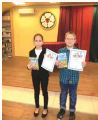
A vetélkedő első helyezettjei