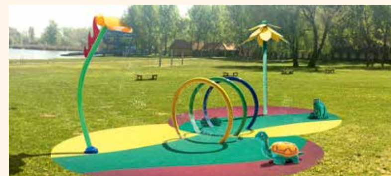
A spraypark egy speciális játszótér, amely nyáron vízzel, vízszugarakkal növeli az élményt. A benne lévő játékok interaktív módon szórakoztatják a gyerekeket

Folyamatban vannak az építéssel kapcsolatos közbeszerzések, a hírek szerint a főszezonra már láthatjuk és élvezhetjük az újdonságokat. Ezzel természetesen nincs vége a fejlesztéseknek, hiszen az elképzelések nagyon sok olyan tervet tartalmaznak, mellyel méltán kerül az idegenforgalom élmezőnyébe a Vadkert-tó.