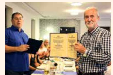
A birkózó szövetség megköszönte a város sportáért tett áldozatvállalását

mára, hogy örömmel és várakozással jönnek ide a magyar birkózósport legjei, ugyanakkor nagy feladat is a szervezőknek, hogy tartalommal töltsék meg a napokat, ehhez pedig