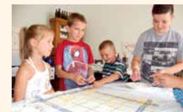
A Nagy-Pál István Helytörténeti Gyűjteményben interaktív foglalkozást is láthattak a képviselők

és Soltvadkert város eredményes együttműködésének szimbólumaként ültetett el a helyi néptáncosok hangulatos táncának kíséretében. A májusban megválasztott Megye Bora verseny