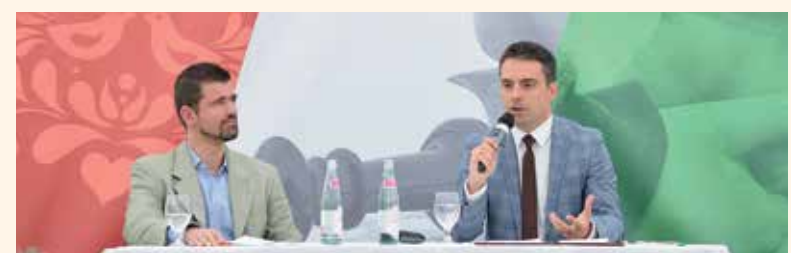
Vona: A Magyarországnak vissza kell szereznie vezető szerepét Kelet-Közép-Európában

Vona Gábor, a Jobbik miniszterelnök-jelöltje a több mint 200 fős közönség előtt megtartott előadásának felvezetőjében emlékeztetett rá, hogy a Fidesz 2010-ben még magasra emelte a polgári eszmék zászlaját, de azt követően gyorsan el is dobta azt, a nemzeti-keresztény értelmiséggel együtt. A Jobbik ugyanakkor számít és kormányzásának elengedhetetlen