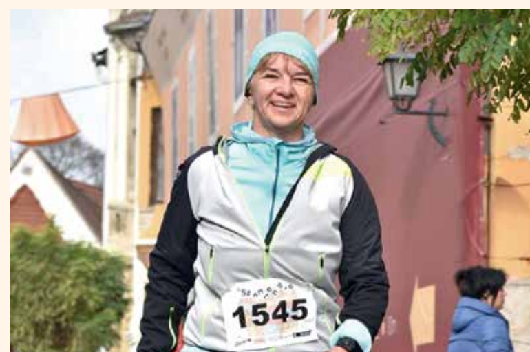
A fotó november 5-én készült Szentendrén