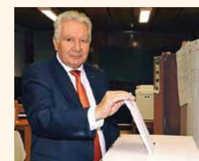
Jakab István, a MAGOSZ elnöke a vadkerti gazdák előtt is ismert

Az Országos Kamarai Választási Bizottság november 6-i ülésén kihirdette a kamarai választások eredményét. A Magyar Gazdakörök és Gazdaszövetkezetek Szövetsége (MAGOSZ) nyerte a Nemzeti Agrárgazdasági Kamara megyei küldöttválasztását mind a 19 megyében. A részvételi arány közel 15 százalékos volt, a szavazók több mint 88 százaléka szavazott a MAGOSZRA. A statisztikák szerint 47 696-an éltek szavazati jogukkal. A rivális Mezőgazdasági Szövetkezők és Termelők Országos Szövetsége (MOSZ) 5324 szavazatot kapott. A Nemzeti Agrárgazdasági Kamara november 3-án tartotta a megyei küldöttválasztást, amikor a választásra jogosult 360 954 kamarai tag a lakóhelye vagy a székhelye alapján kijelölt szavazási körzetközpontban adhatta le voksát a megyei küldöttjelöltek neveit tartalmazó zárt listára, melyek között soltvadkerti