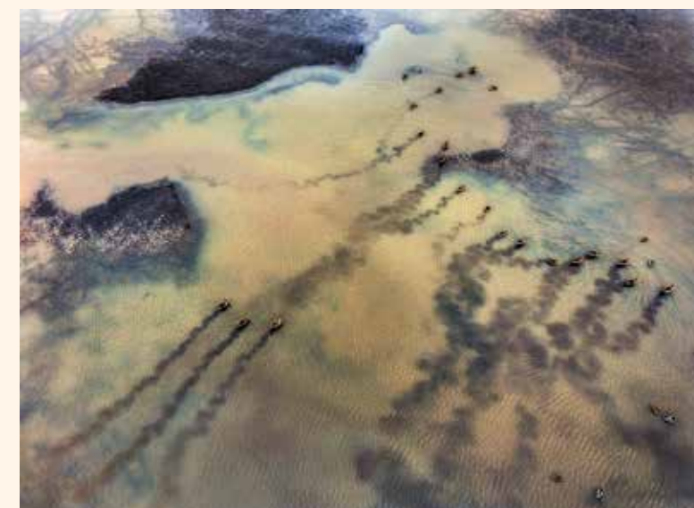
A győztes fotó egy halastó medre fölött készült februárban, melynek vizét télire leeresztették. A sekély, téli csapadékvizet tartalmazó mederben közlekedtek a madarak, felkavarva az iszapot, amely érdekes formákat alkotott

nak, akik szeretik felfedezni hazánk szépségeit. Majd Németországban nyertem egy második díjat, több ezer fotós munkái között. Romániában a Transnatura természetfotós pályázatán szintén nyertem egy második díjat, míg a Milvus pályázaton egy első és egy második díjjal ismer-