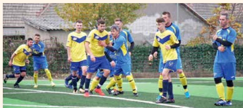
A Kaskantyú ellen 4:1-re győztek