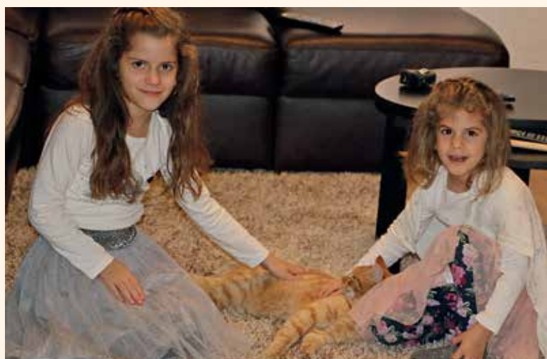
Vöri cica, a lányok kedvence sem unatkozik a családban