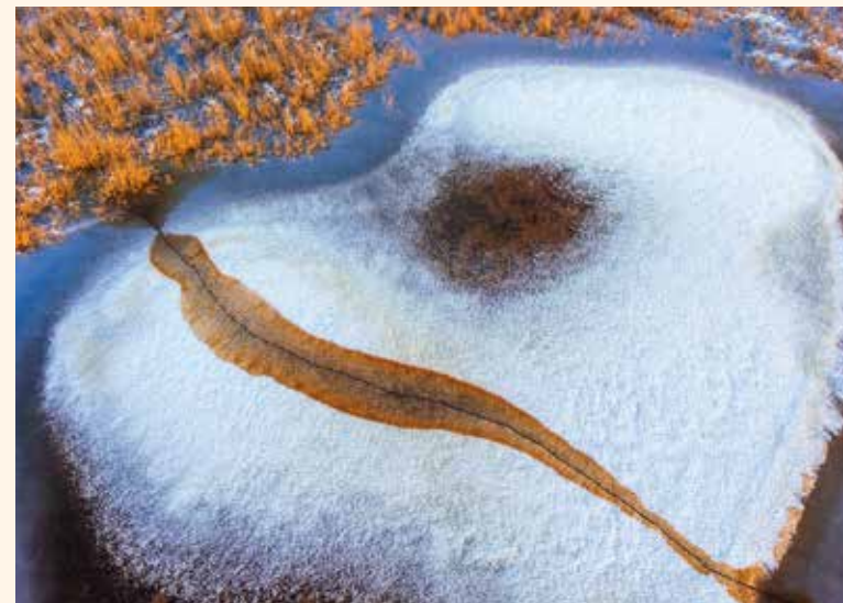
Az Akasztó környéki januári tavakon az elrepedt jég alól felszínre szivárgó sárgás víz különleges formát ad az egyébként is érdekes alakzatnak

jutalmaztak. Aztán a Varázslatos Magyarország című projekten előző egész éves munkámat ismerték el egy fődíjjal. Erről a pályázatról csodálatos könyv jelent meg, remek ajándéknak ajánlom így karácsony tájkán azok-