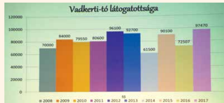
A vadkerti tó látogatottsága rekordot döntött

egészen Kiskunmajsaig érjen egyszer az új út. Arról is tájékoztatta a jelenlévőket, hogy tervezési szakaszban van a Soltvadkertet elkerülő út, így biztosan megvalósul, mint ahogyan a Budapest-Belgrád vasútvonal is, ami nagy hatással lehet majd a város életére. A személyszállítás is nagy nyertese lesz, de elsősorban tengelyes teherszállítás miatt jön létre. 160 km-es lesz a szerelvények legmagasabb sebessége azért, hogy ne kelljen mindenütt felújításokat építeni, utakat lezárni. A gyors és biztonságos személyszállítás mellett komoly logisztikai feladat várhat