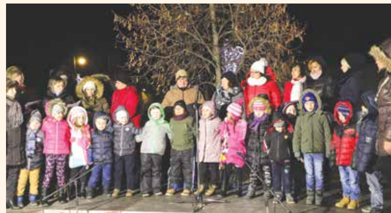
Az első és a második gyertyagyújtást is az ovisok műsora színesítette

iskolás diákjainknak, énekkarainknak köszönhetően. Az adventi sátrak forgatagában tartalmas időt tölthetett mindenki és kóstolhatta az ízletes ünnepi falatokat, a helyi értéktárba került sváb káposztás kolbászt, forralt bort, teát kortyolhatott a civil szervezetek, intézmények jóvoltából.