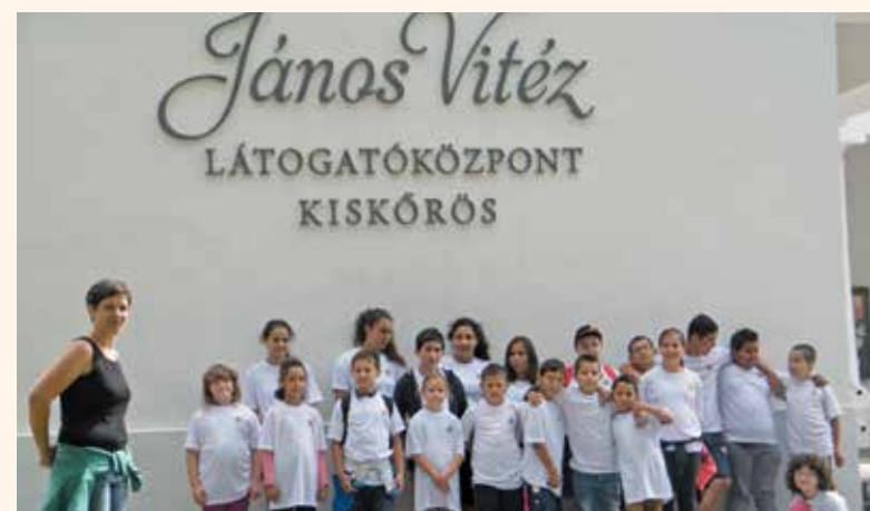
Boldog és sikeres program volt az Erzsébet táborunk egy héten át húsz gyermekkel