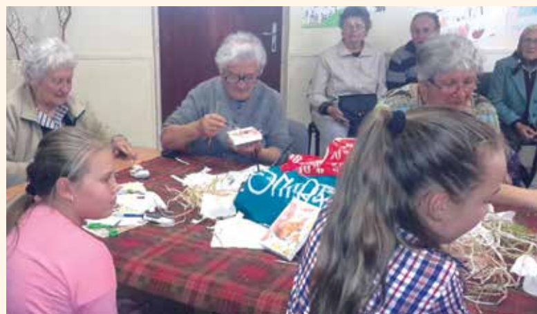
A többgenerációs kézművesprogram kedvelt időtöltés volt