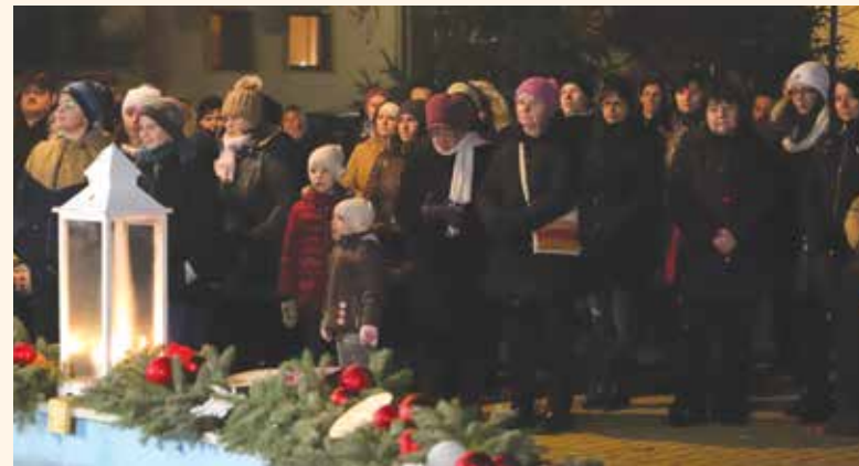
Advent harmadik vasárnapján is megtelt a tér ünnepvárókkal