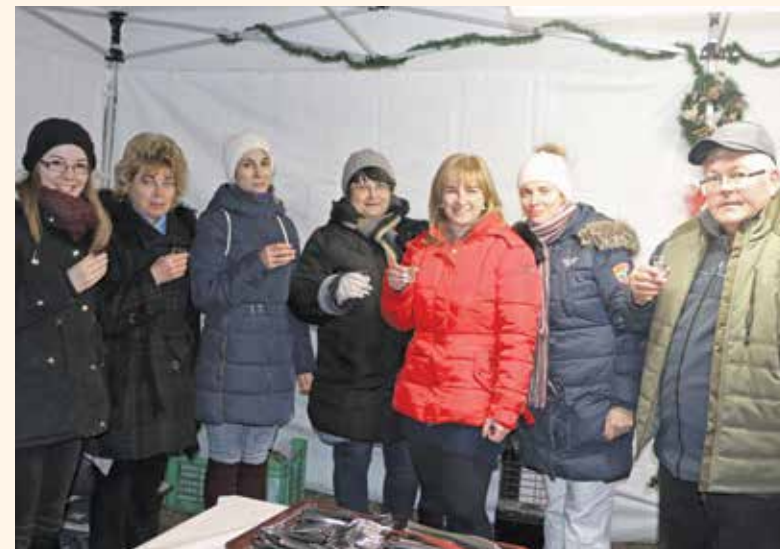
Lelkes készülődés, jó hangulat jellemezte az adventi alkalmakat