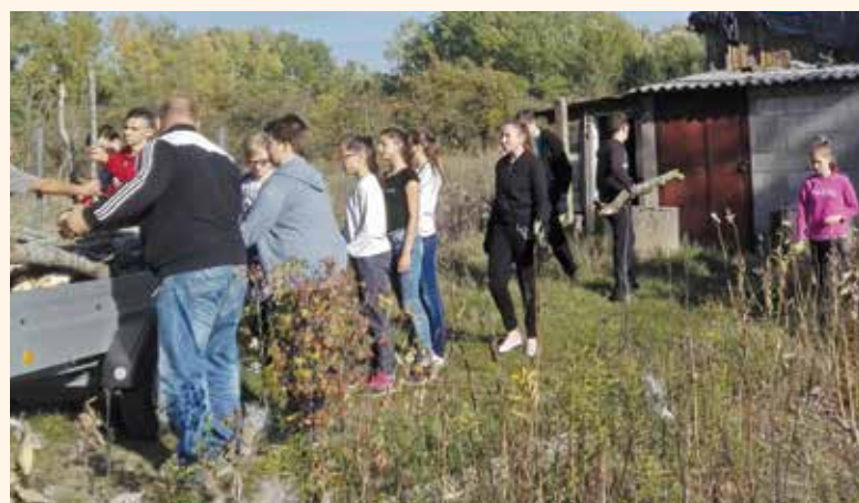
Tűzifagyújtás a 72 óra kompromisszumok nélkül program keretében