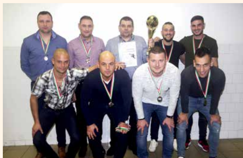
A Gra-Plast a torna második helyezette