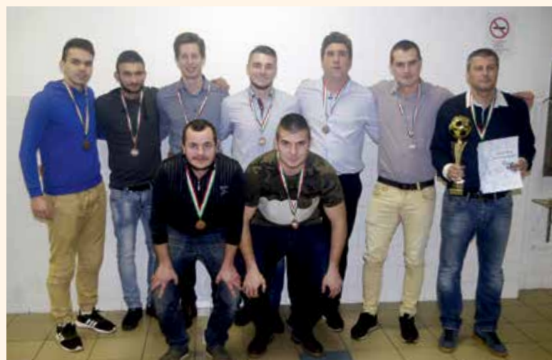
A Warriors csapata a bronzérmet szerezte meg