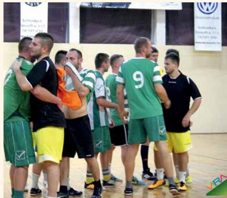
A Néro SC bravúros játékkal faragta le a hátrányát

Véget ért a Soltvadkerti Fakupa Kispályás Teremlabdarúgó Bajnokság 2017/2018-as küzdelemsorozata. A résztvevő csapatok egy ünnepélyes eredményhirdetéssel zárták az évszámot. A hét közben, esténként lebonyolított mérkőzések után alakult ki a felsőház és az alsóház mezőnye. A felsőházba az 1-4. helyezettek kerültek, akik a dobogós helyekért küzdhettek, míg a többi gárda a helyosztó találkozókon mérhette össze erejét.