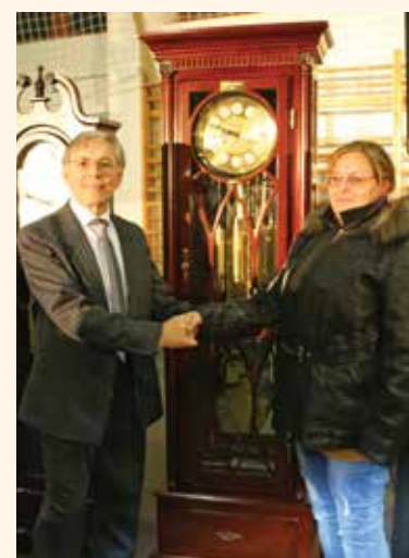
Állóra volt a földj, Tázlára került

A gálaműsor fénypontját minden évben a sorsolás jelenti, ahol több százezer forint értékű ajándékok, órák találnak gazdára. Nagyon sok soltvadkerti vehetett át értékes nyereményt az esten és többen is átvehettek volna, ha eljönnek a rendezvényre, hiszen csak az kaphatta meg az értékes ajándékát, aki személyesen ott van. Természetesen mindenki a két földjra utazik ilyenkor, arra a szekrényes órára, mely a lakás elegáns és értékes bútordarabja lehet. Idén Tázlára került a legszebb állóra, a nyertest és az ünneplő közönséget lufieső borította be a gyerekek nagy öröme.