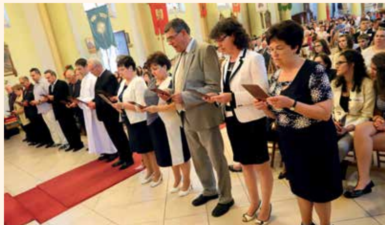
Esküt tettek a helyi katolikus egyház újonnan választott világi képviselői