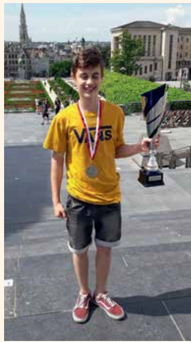
28 mérkőzésből 28 megnyert meccs. Ennél már nincs jobb!