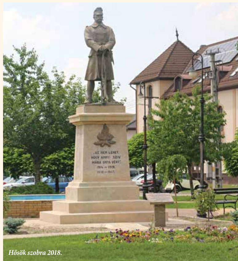
Hősök szobra 2018.

Valószínű, hogy a szöveg 1945 után került fel a talpazatra. 1931-ben 332 I. világháborús elesett hős neve került fel. Majd a II. világháború utáni időszakban 11 hősi halott nevét vésték fel. Vadkerti előjárósága méltón ünnepelte meg a nagy mű elkészültét. A hatóságoknak és a környező településeknek a következő meghívót küldték el: