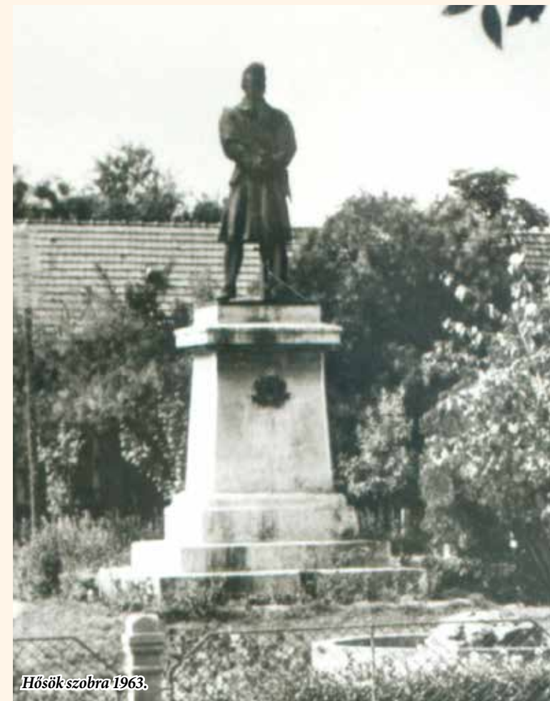
Hősök szobra 1963.