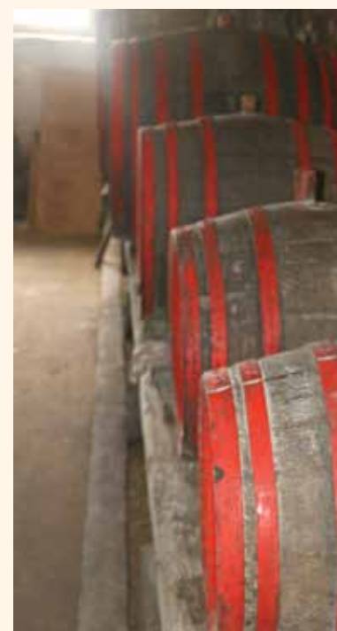
Manapság már alig látni ilyen hordókat