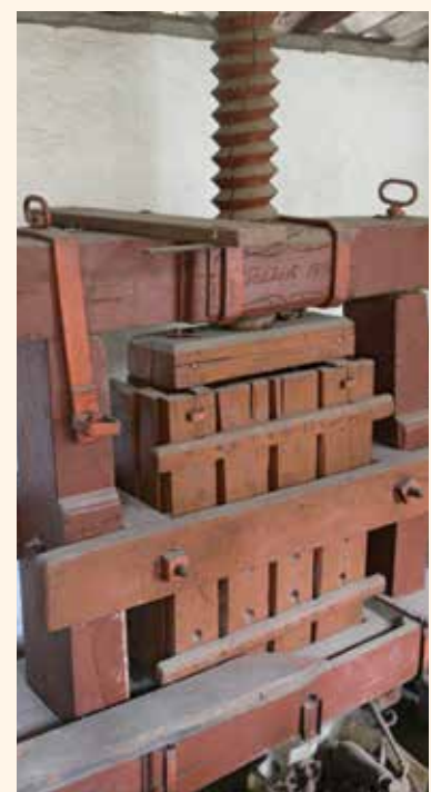
100 éves faprés