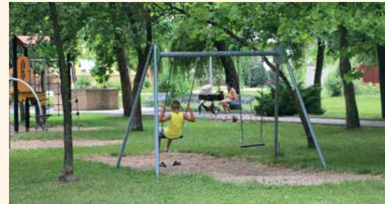
A Lukács-park a fiatalok kedvelt találkozóhelye