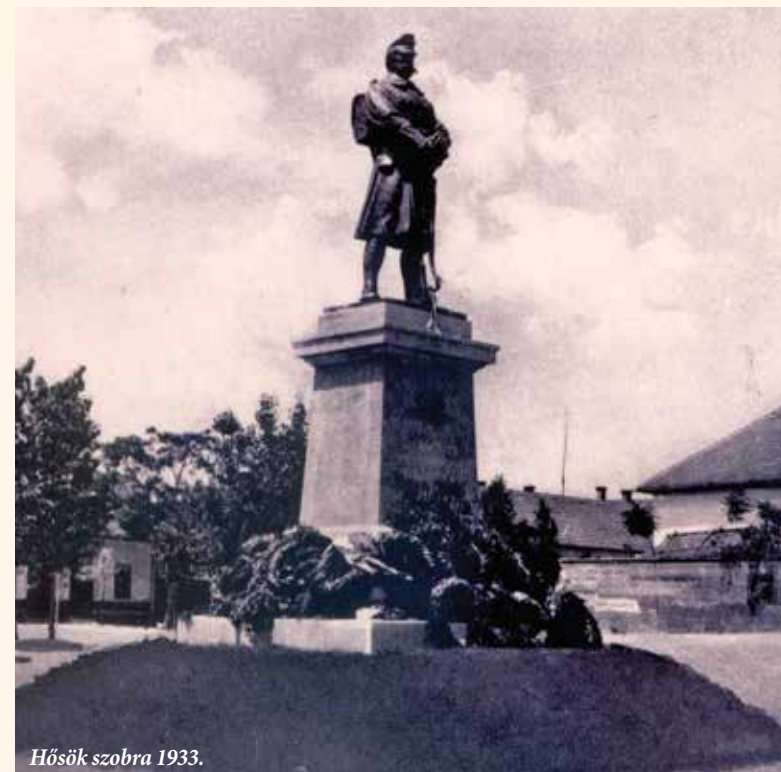
Hősök szobra 1933.