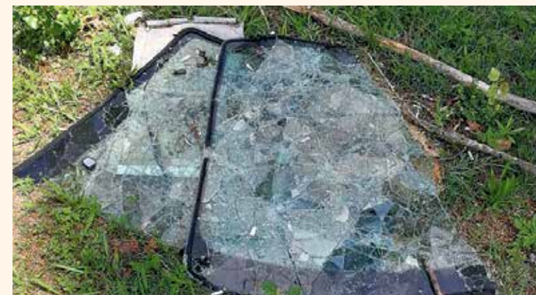
A park rendeltetésszerű használata ellen való a vandalizmus, a felelőtlenség, amit nem vidékiek követnek el