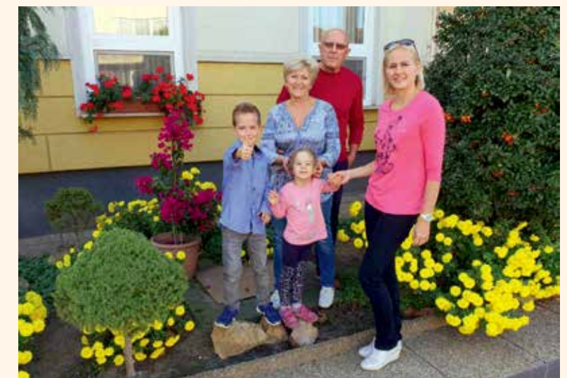
Családi háttér nélkül nem lehet sikerre vinni egyetlen vállalkozást sem

► A nemzeti ünnepnek személyre szóló üzenete van számodra.