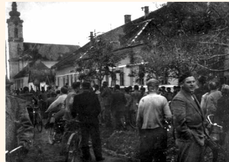
Egy Soltvadkerten titkosan készült korabeli felvétel

Vadkerti Újság, XXV. évf. szept., 10 p. Légrády