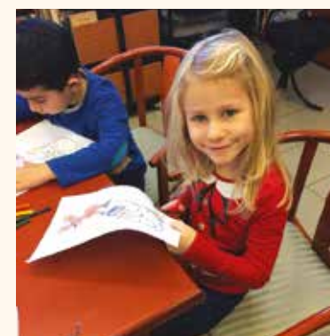
Kézműves foglalkozáson vett részt két csoport a Gyöngyház Kulturális Központban

Az óvodák köszönik a BS Plastic Kft.-nek a Mikulás- és karácsonyi ajándékot, valamint a pénzületi adományt, amelyet a tornaterem eszközeinek bővítésére fordítanak. De köszönetét fejezi ki az Evangélikus Egyházi Óvoda és a Kossuth Lajos Evangélikus Iskola is a nagylelkű ajándékokért, adományokért!