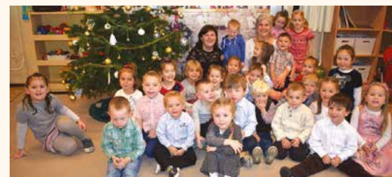
Karácsonyi díszbe öltöztek a csoportok az Arany oviban is