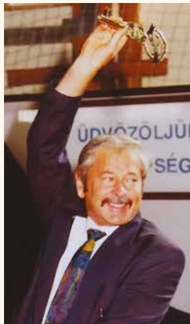
Soltvadkert városi rangot kapott 1993-ban

Racionális, gyakorlatias gondolkodása stabil pénzügyi paramétereket biztosított a város gazdálkodásában is, melynek köszönhetően a város