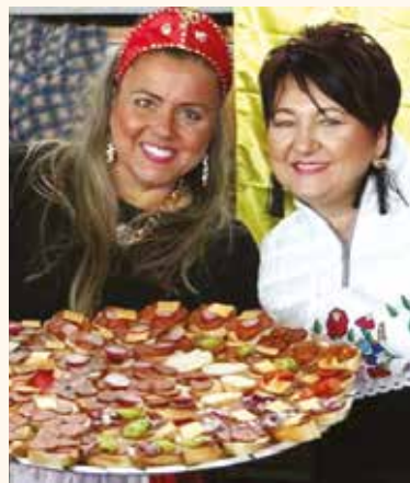
A kalocsai mintás kötények erre az alkalomra készültek