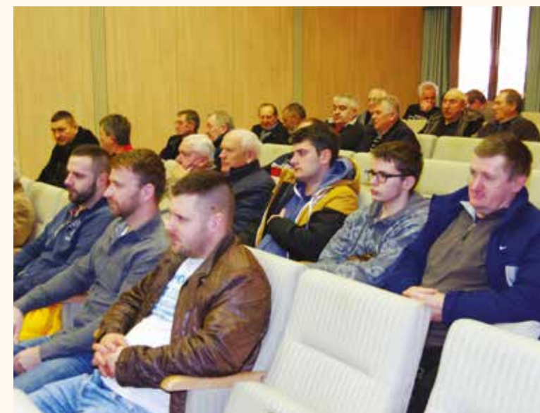
A 450 fős tagságot 60-an képviselték

A több évtizede elmaradt tesztelés arra enged következtetni, miszerint nem állunk rosszul a halállomány tekintetében, és a tó vízének minőségét is folyamatosan ellenőrzés alatt tartják.