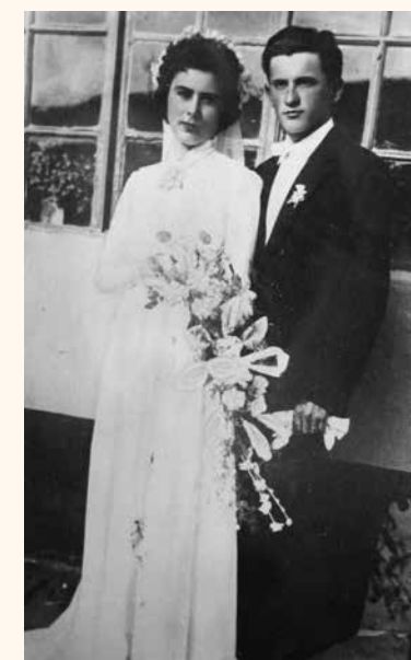
60 évvel ezelőtti boldog pillanat