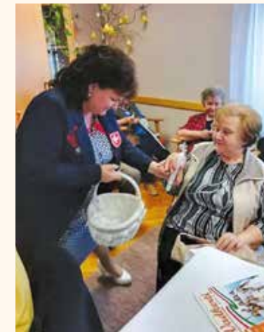
Az idősek klubjában szeretetgyertyát kaptak a szeretetszolgálattól