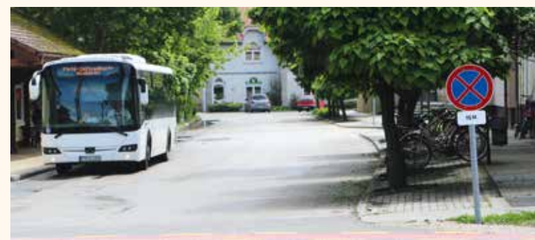
A Kossuth utcáról így biztonságos a lekanyarodás