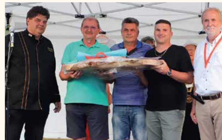
A főzőversenyt a horgászok nyerték