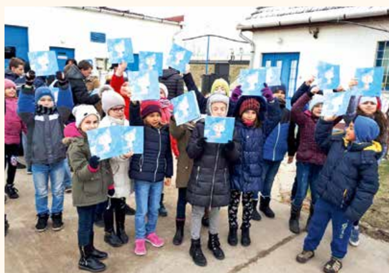
Ez a januárban készült, csapvíz fogyasztását népszerűsítő fotó most hűsítőleg hat a nagy melegben

A Kossuth Lajos Evangélikus Általános Iskola és Alapfokú Művészeti Iskola Tanulóiért Alapítvány 14,86 millió Ft összegű támogatásban részesült az EFOP-1.8.5.-17-2017-00191 „Menő menzák az iskolában – egészséges étkezést és életstílust népszerűsítő programok” című pályázaton az „Együnk jól, éljünk jól!” projektjével. A pályázat megvalósítása