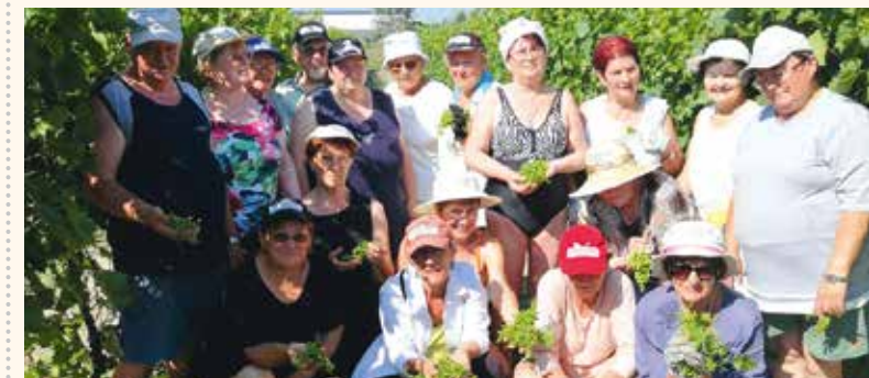
Csipkóné Gyöngyiéknél az Aktív Nyugdíjas Klub tagjai vonultak fel, hogy segítsék a zöldszüretet

Június 24-től hivatalosan is elkezdődött a zöldszüret azon termelők részére, akik támogatási kérelmet nyújtottak be, és a kincstártól a 24-i határidőig nem kaptak elutasító határozatot. A gazdáknak július 10-ig kell a műveletet elvégezni, és a befejezést követő egy munkanapon belül az illetékes hegybíróhoz és a Kincstárhoz a süret végét bejelenteni. Ahány ember, ahány gazda, annyiféle érzés és vélemény fogalmazódik meg. Nyilván azt le kell szögezni, hogy senki nem szeretettel dobja a földre a szépen mutatkozó fűrtöket. De meg kellett érteni a piaci viszonyokat, a kialakult helyzethez alkalmazkodva pedig ez volt a legokosabb döntés.