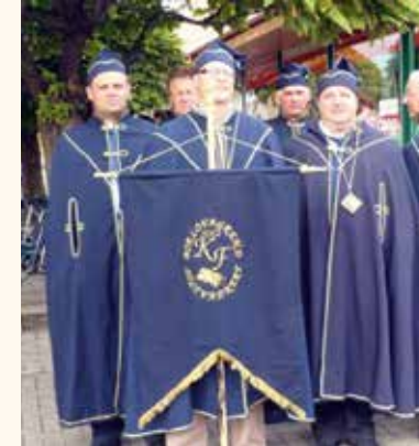
A borlovagrend oszlopos tagja, ceremóniamestere

– Elgondolkodott-e már valaki azon, hogy miért Soltvadkertben van az ország legnagyobb hegyközsége, hogy miért éppen itt készülnek legnagyobb számban a műanyag táskák, fóliák, miért van annyi Soltvadkertről elszármazó élsportoló, miért járnak külföldi díjátadókra soltvadkertiek, miért emelkednek ki a soltvadkertiek borászatok a régióból, miért európai hírű a soltvadkertiek fagyja? És még biztosan lehet duzzasztani a felsorolást, ami a valóságot mutatja, és ezek nem kiüresedett szavak csupán. Ezekre a kérdésekre a válasz talán az átlagnál nagyobb belső motiváció – legalábbis számomra ezt jelenti – de ez az, ami, úgy gondolom, minden soltvadkertiben jelen van. Ez határozta meg településünk fejlődését, és ez is kell, hogy meghatározza a jövőben is. Egészen egyszerűen úgy fogalmaznék, hogy a legjobbra kell törekedni tárgyi