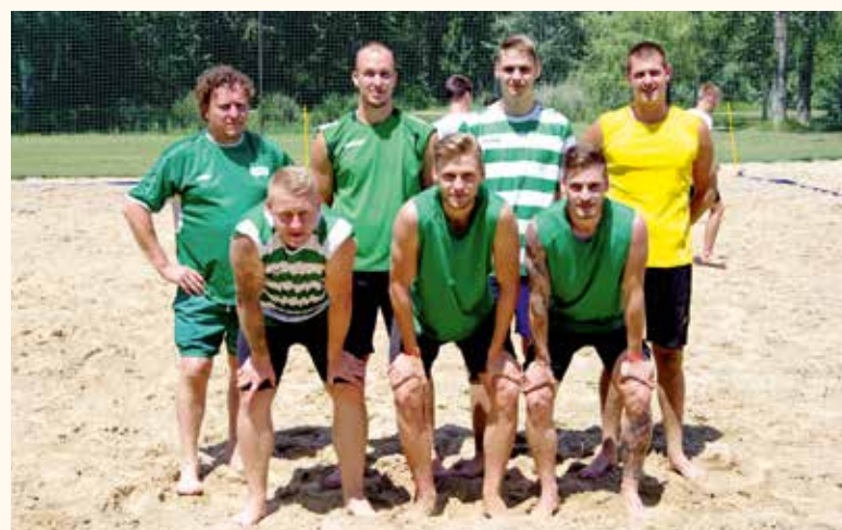
A Turbo Run közepmezőnyben zárt

ses formában. Az itt elért eredmények alapján a csoportok harmadik és negyedik helyezettei keresztbe játszással folytatták az egyenes kieséses szakaszban. Ezek után a vesztesek a 7. helyért, a győztesek pedig az 5. helyért játszottak. Csoportok első és második helyezettei a keresztbe játszás után a vesztesek a bronzéremért, a győztesek a döntőben léphetek pályára. Különösebb vitáktól és sérülésektől mentes volt a torna, amelyhez szinte végig kegyes volt az időjárás. A játékosoktól láthattuk a strandfoci minden szépségét, technikás megoldásokat, és szinte minden mérkőzésen született ollózásból gól. Szerencsére még az igazi presztízsmérkőzéseken sem ment át a játék durvaságba, és a legparázslóbb vita is csak a mérkőzés lefújásáig tartott.