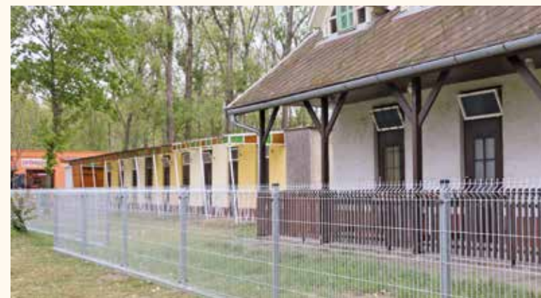
A kerítésügy jelenlegi állása szerint lecserélték a kabinsor előtti kerítést a közös megállapodás értelmében