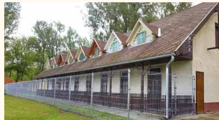
Az eredeti, megállapodás előtti helyzetkép

A tóparton csatangolva, a változásokat szemlélve figyeltem fel két, söröskorsó mellett beszélgető, középkorú, általam ismeretlen férfit, miután megütötte fülem a kerítés szó. Gyorsan világos lett, hogy nekik szintén nem tetszik a kabinsor előtti „rács”, de abban is igazságot fogalmazott meg egyikük, hogy nem lett volna ebből ekkora cirkusz, ha nem éppen választások jönnének, és nem lenne a pankráció. De amint mondta, most a bolhából is elefántot kell csinálni... és eztán eléggé nyomdafestéket nem tűrő mondatok következtek. A kerítésnél maradván, nyilvánvaló annak esztétikai hiányossága, ezt belátva és elismerve született a lehetséges korrigálás szándéka, majd a párbeszéd alapján döntés az érintett tulajdonosok és az önkormányzat között. Erre vonatkozóan adta ki a város az alábbi közleményt: