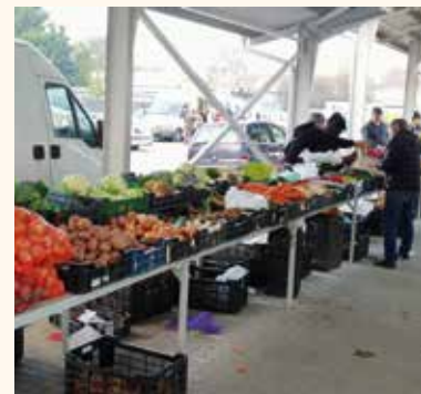
Közel ezer m 2 fedett téren értékesíthetnek a termelők