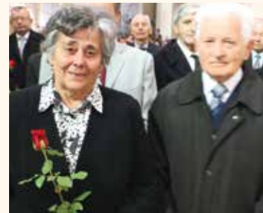
60 éves jubileumot ünnepeltek