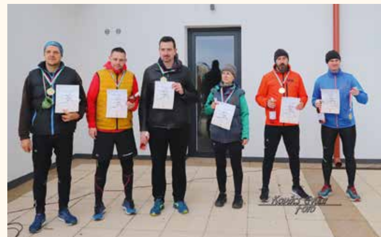
Az első maratont teljesítők