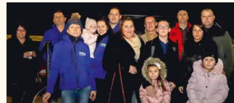
Már több mint tíz évre visszanyúló hagyománya van annak, hogy a Soltvadkert Motorsport Racing Club tagjai szenteste forralt borral, meleg teával, és a csapat hölgy tagjainak jóvoltából karácsonyi süteményekkel vendégelik meg a templomokból kijövő és a Kodály Zoltán utca általános iskolai végénél összegyűlt lakosságot