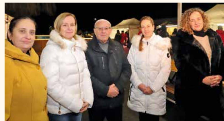
A Soltvadkert Város Gyermekéiért Alapítvány kurátorai

rekszemeket, amikor a kicsik sorban álltak a korcsolyákért a hétvégén. Köszönet mindenkinek, aki részt vett a kialakításában és hozzájárult ahhoz, hogy ez a létesítmény színesíthesse a vadkerti telet.