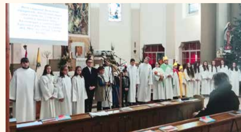
A katolikus templomban pásztorjáték jelenítette meg Jézus születésének történetét a hittanos gyermekek jóvoltából