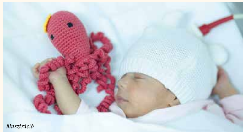
A horgolt koripok a babák egyetlen pajtásai az inkubátorban

Azt is szeretnénk megmutatni, hogyan tudják segíteni az önkéntesek a babák biztonságos fejlődését.