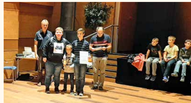
A Szekszárdon győztes csapat tagjai