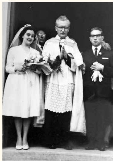
55 évvel ezelőtt