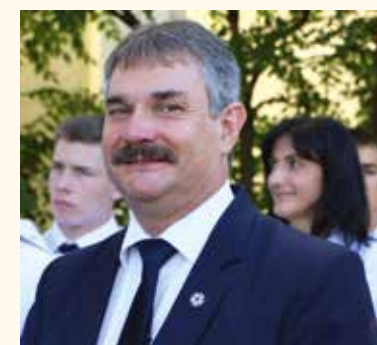
A fotó a tavalyi ballagáson készült

Így büszkeséggel töltöttek el azok a tanulók, akik 8 évvel ezelőtt minden tanévét kitűnő tanulmányi eredményekkel zárták, a tanév végén többen sikeres nyelvvizsgát tettek, akikre szintén büszkék vagyunk, mint ahogyan sportolóinkra, akiket emléklappal jutalmazunk. Gazdára talál a Diákönkormányzati díj, mely oklevél mellett egy vásárlási utalványt tartalmaz. A Művészeti Iskola Kiváló Tanulója címet is átadjuk ebben az évben is, mint ahogyan a „Kossuth Lajos Általános Iskola Jó tanulója, jó sportolója” kitüntetését is. Tantárgyi eredmények, versenyek alapján is jutalmazunk diákokat,