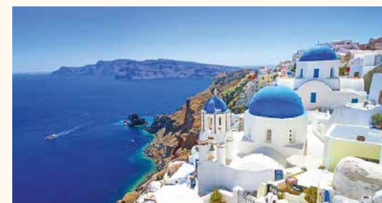
Görögország vált leghamarabb nyitottá a turisták fogadására

Franciaország egyelőre csak az indokolt esetben történő beutazást engedélyezte külföldről. A strandok megnyitottak, de a napozás, fürdőzés még tilos. Spanyolországban régióként eltérő ütemben oldják fel a korlátozásokat. Valószínű, hogy a szigetekre, így Mallorca-ra is hamarabb utazhatnak külföldiek, mint a nagyvárosokba. Barcelona csupán néhány napja nyitotta meg parkjait, strandjait saját lakosai előtt.