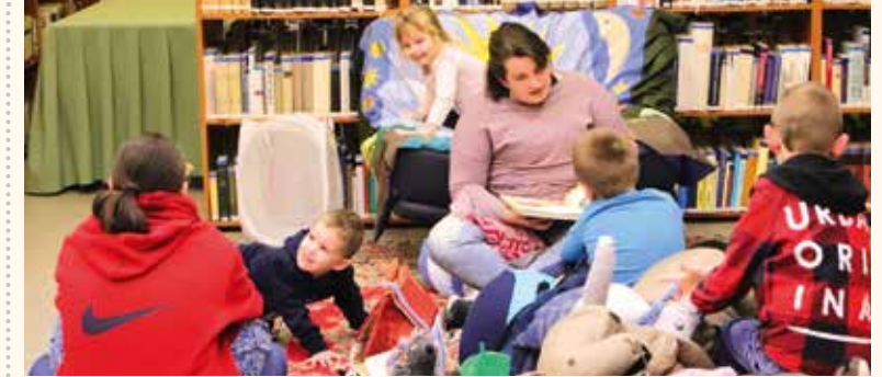
A Gyöngyház Kulturális Központban népszerű a Meseklub

A mai rohanó, modern világban, mikor már szinte teljesen az életünk részévé váltak az elektronikai eszközök, még fontosabb szerepe van a mesélésnek. És itt fontos megjegyezni, hogy mesélésről van szó, melyet a szülő, nagyszülő mesekönyvből vagy saját fejből elmesél. A mondott mesének nagyon nagy szerepe van a gyermek idegrendszeri és lelki fejlődésében is. A tévéből vagy telefonon nézett mesét össze sem lehet hasonlítani azzal, amit felolvasnak, elmondanak.