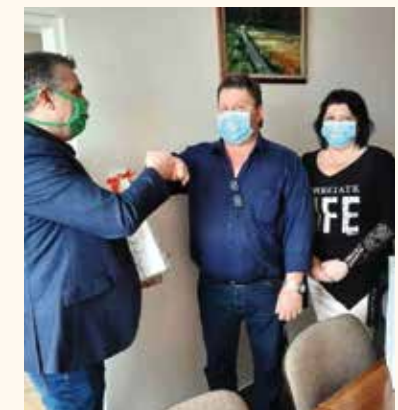
A kiskunhalasi korházban is jótékonykodtak