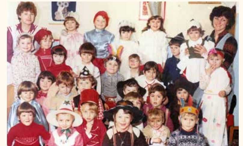
Jelmézbáli pillanatok az 1980-as évekből

– Nagyon sok mindent papírra tudnék vetni a tapasztalataim, élményeim alapján. De ami a leginkább felhangosodik