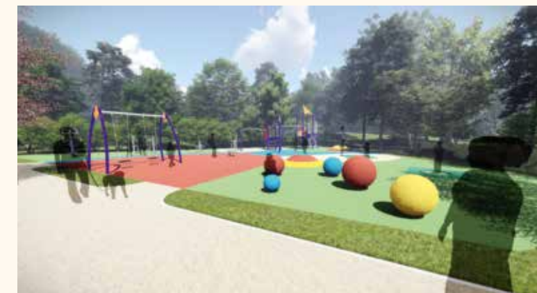
Az új, európai színvonalú játszótér látványterve

sportiskolai programunk szerint dolgozunk. Kiemelt jelentőségű a német nemzetiségi nyelvtanítás a Soltvadkert Gyermekéiért Alapítvány támogatásával. A táncoktatást már 2014-ben bevezettük, az első négy évfolyamon felmenő rendszerben. Iskolánk életében ez azért nagy attrakció, mert az