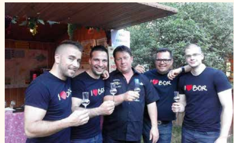
A Vivat Bacchus bordalokat énekel, de a jó pálinkát sem vetik meg