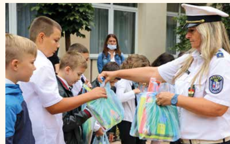
A tavalyi közlekedési rajzpályázat résztvevőit díjazta a rendőrség