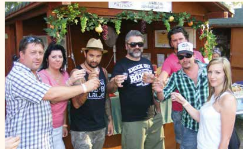
Magna Cum Laude tagjaival is jó barátok

Mintaboltunkban minden termék megvásárolható!