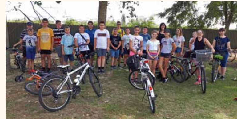
Emlékezetes marad a bócsai bicajútra