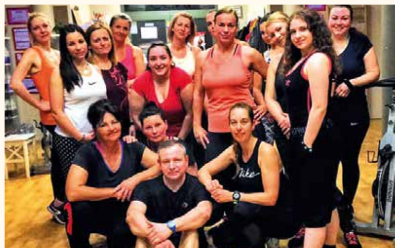
Egy hagyományos húsvéti tekerés még 2018-ból, de minden évben sort kerítenek az ünnepi helyben bringázásokra