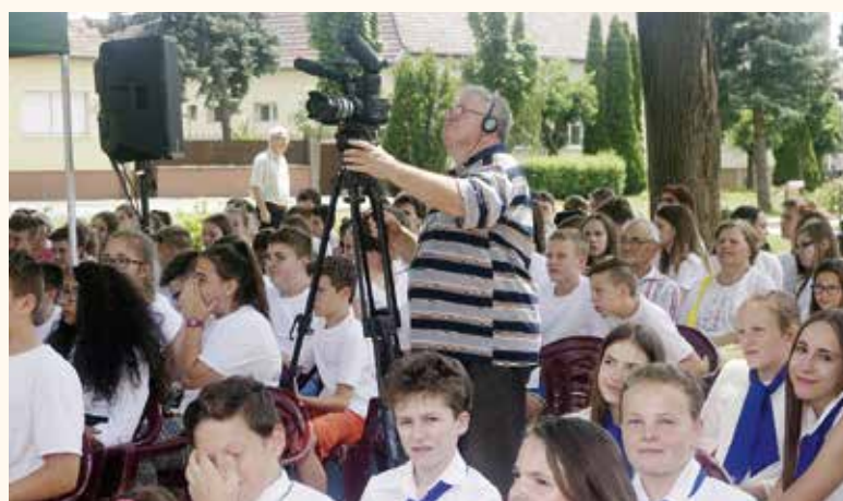
A televíziós minta lesz a gyerekek számára

Csütörtökön sugározzuk az adott héten a következő új műsort 120 percen, amit szintén Soltvadkerti Magazinunk nevezünk. Ebben elsősorban hosszabb anyagokat közlünk a lehető legszélesebb témában. Van ebben sportközvetítés, kultúra, vallási műsor – csak hogy néhányat említsek.