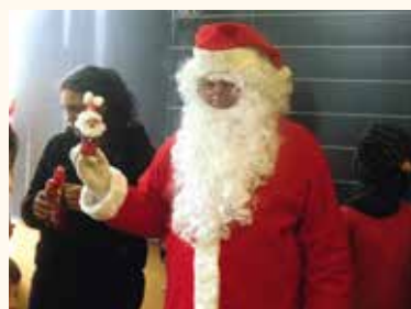
Tanárként a diákokért...

– A Soltvadkerti TV mai formájában húsz éve működik. Működését a folyamatos bővülés, fejlesztés, szakmai igényesség jellemzi – mondja a szakember. – Helyi média révén igyekszünk lehetőséget adni mindenkinek a megszólalásra. Az információk után mi magunk is sokat megyünk, de annak örülünk a legjobban, ha az érdekeltek jelzik, hogy közérdeklődésre számot tartó dolog történt a környezetükben.