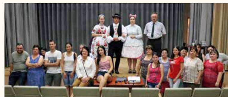
Amikor még találkozhattunk... nagy sikere volt a népszerűségi tábornak

• Összefogással elkezdődtek és folynak a Soltvadkert város történetét szemlélő feldolgozó helytörténeti könyv előkészítő munkálatai. A megbeszélések, egyeztetések során társakat kerestünk és nyertünk egy-egy fejezet összeállításához.