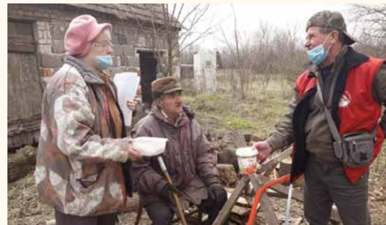
Ötven adag meleg ételt osztottak szét a szolgálat aktivistái