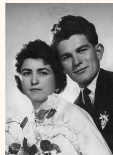
Boldogító igen 1960-ban

Végtelen hideg volt, télikabátban mentünk az esküvőre.