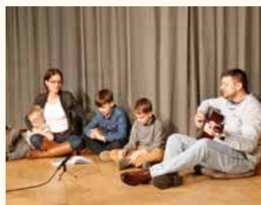
Medveczkiék családiról léptek színrre

Reméljük, hogy eljön az idő, amikor már csak rossz emlékként őrizük ezt a járvánnyal terhelt időszakot, ami egyik napról a másikra változtatta meg gyökeresen az életünket. Ez azonban nem jelenti azt, hogy karba tett kézzel várjuk a szabadságot, amikor újra minden a régi, vagy annál is