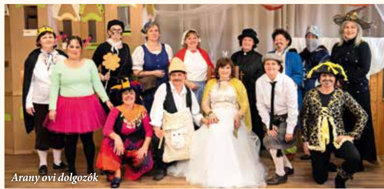
Arany ovi dolgozók

óvó nénik a csoportokban. Mindkét óvodánkban meglepetés mesével kedveskedtek az óvodapedagógusok és a dajka nénik a gyermekeknek. A Bocskai utcai Óvodában az „Aranyzörű bárány”, az Arany J. utcai óvodában pedig a „Csodafurulya” című mesét adták elő, a gyermekek nagy örömeire. A bál hangulatát emelte a sok finom farsangi fánk, sütemény, gyümölcs, melyről a szülők gondoskodtak, amit ezúton is köszönünk!