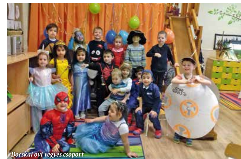
Bocskai ovi vegyes csoport