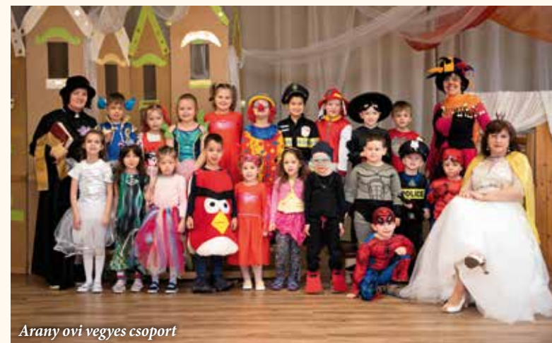
Arany ovi vegyes csoport