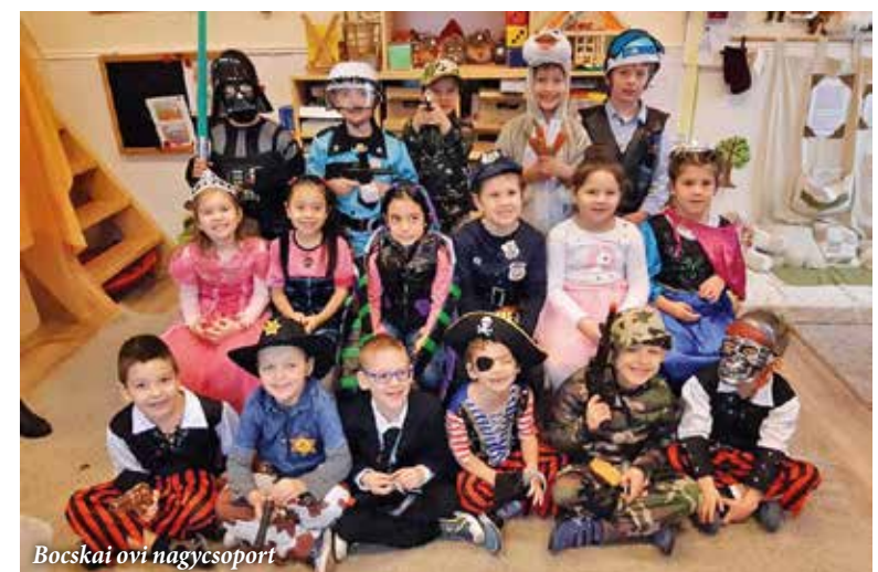
Bocskai ovi nagycsoport