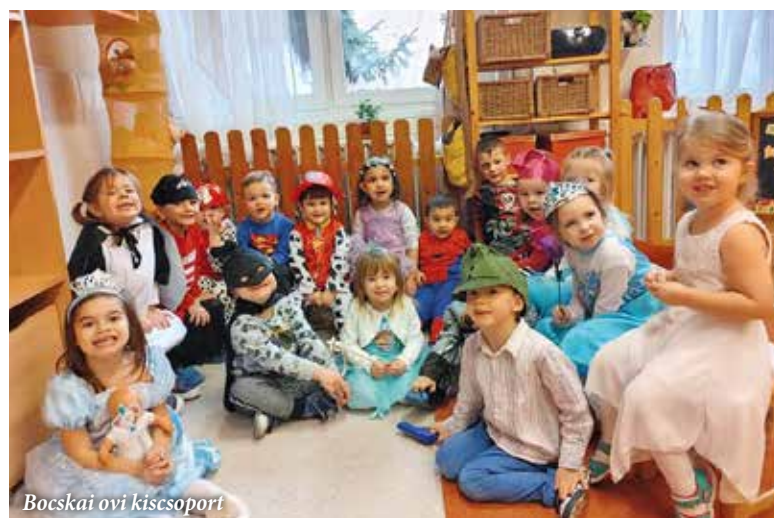
Bocskai ovi kiscsoport