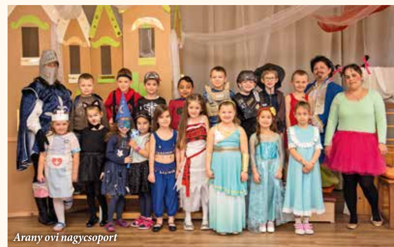
Arany ovi nagycsoport