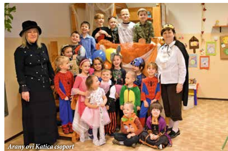
Arany ovi Katica csoport