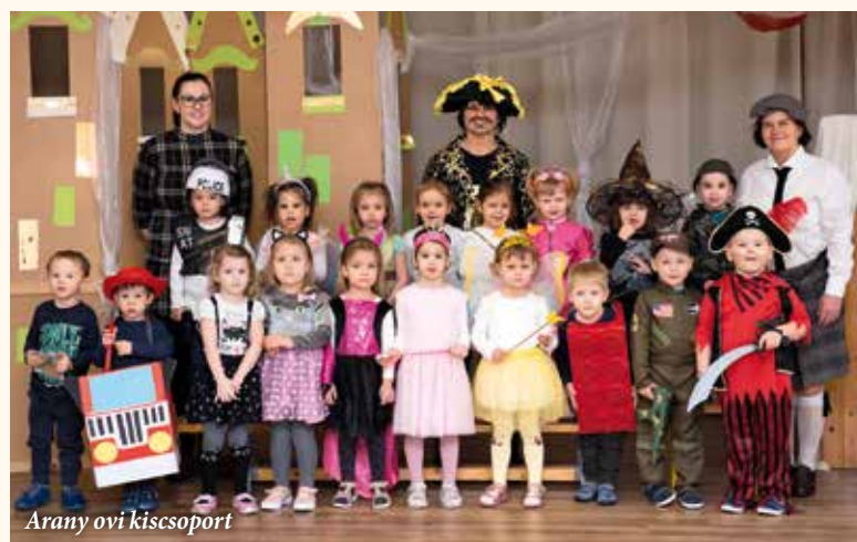
Arany ovi kiscsoport