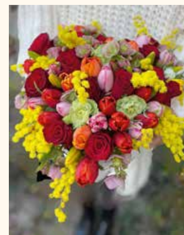
Móni egyik kedvence a mimóza

– A virág örök, ezt leszögezhetjük. Annak pedig kifejezetten örülök, és nagyon pozitív jelenségnek tartom, hogy megjelentek a fiatalok. Szívesen ajándékoznak a fiatal srácok virágot a szeretett lánynak, nem sajnálják rá az