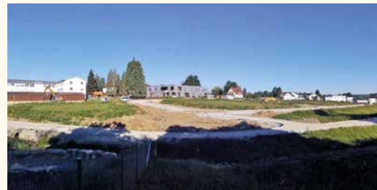
Építési terület Oberwiesen II.

A 2020-as év biztosan nem volt egy átlagos év, és sok mindenen kellett változtatnunk. Nagy valószínűséggel különleges évként kerül be a történelembe, és semmi kétség, sokáig fogunk rá emlékezni. Egy pillanat alatt a „pandémia” többé már nem egy elvont vízió volt, hanem valóság, ami a mai napig meghatározza az életünket. A válságkezelés határozta meg az önkormányzat munkáját, Bodelshausen életét.