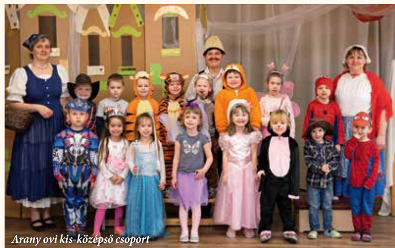
Arany ovi kis-középső csoport