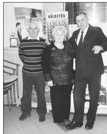
Az Ágó-házaspár és Balczó András a korabeli plakát előtt.

Balczó András volt a vendége a művelődési háznak november végén. A háromszoros olimpiai bajnok öttusázó még 73 évesen sugárzó egyéniség. Az 1976-ban vele készült „Küldetés” című portréfilm százazereket vonzott annak idején az ország mozijaiba. Sok mindent kimondott a rendszerről akkor is és ma is. Sajnos korunkban sok embernek nincs más megoldása, mint az, hogy egyszerűen eladja a lelkét: multinak, pártnak, szektának... Egyéni példája, az igazság keresése és védelme talán támaszt nyújtott azoknak, akik eljöttek erre a beszélgetésre advent első vasárnapján.