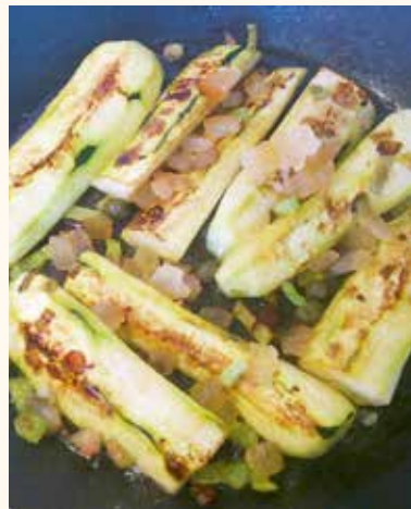
A szalonnás cukkini könnyű vacsora

▶ Saját ételled a kedvenced? – Természetesen a kedvenc csakis édesanyám főzti lehet. Nem vagyok édesszájú, így nagyon tud ízleni egy sima csülkös bableves, egy egyszerű rizshús, vagy egy „paradicsomos húsfazék”. Újabban igen kedvelem a halféleségeket, a vadételeket, időnként vadászom is, de csak hobbi szinten. A sütemények kategóriájában pedig