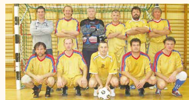
A torna két vadkerti legeredményesebb csapata: fent a Százlábúak együttese, lent a Gra Plast gárdája.

Izgalmas végjátékban dönt el a fakupa sorsa február 3-án este. Már a korábbi teljesítmények alapján is kirajolódtak az erőviszonyok, sejteni lehetett, hogy a szomszédok igencsak rávernek a mezőnyre. Ez a végeredményben is igazolódott, hiszen Bócsa vitte el a pálmát a Gra Plast és a Turbo Run előtt az idei fakupa sorozat felsőházában. A győztes 12 ponttal állhat a dobogó legfelső fokára, míg a Gra Plast csapatának 8, a Turbo Runnak 3 pontot sikerült összerúgni.