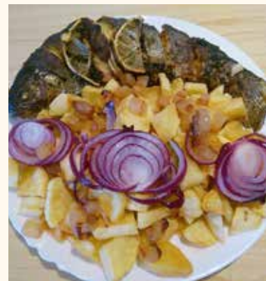
A pisztráng igazi ingyenc fogás

▶ Otthoni minta, mester azért csak volt? – Teljesen autodidakta módon kezdtem el főzni, soha nem tanított senki. Ha valamilyen étel nagyon érdekelt, de nem tudtam miként kezdjek hozzá megkérdeztem persze a családom hölgytagjait.