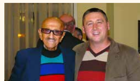
Szipáli Márton fotóművész adta át a különdíjat