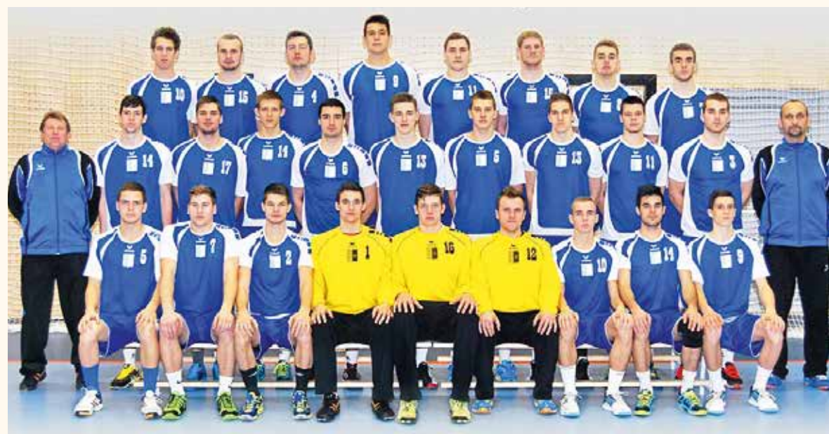
A Balatonfüredi KSE Junior csapata