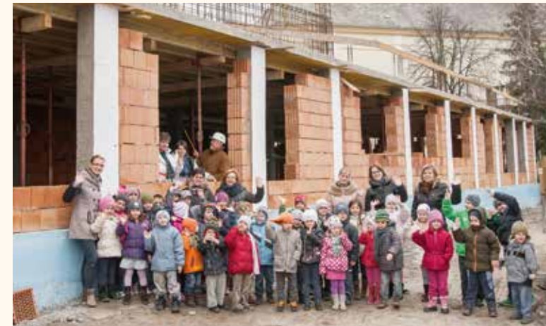
Az óvónék is rendszeresen mesélnek a gyerekeknek az épülő óvodáról, és ha tehetik, megnézik, hol tart az építkezés...