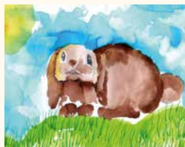
Furák Eszter 1.o (Nyuszi ül a fűben...)