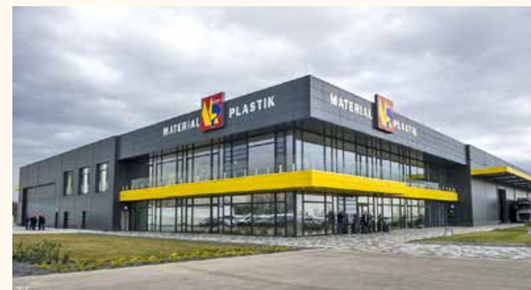
A Material Plastik Kft. évek óta a legtöbb adót fizeti a város kasszájába