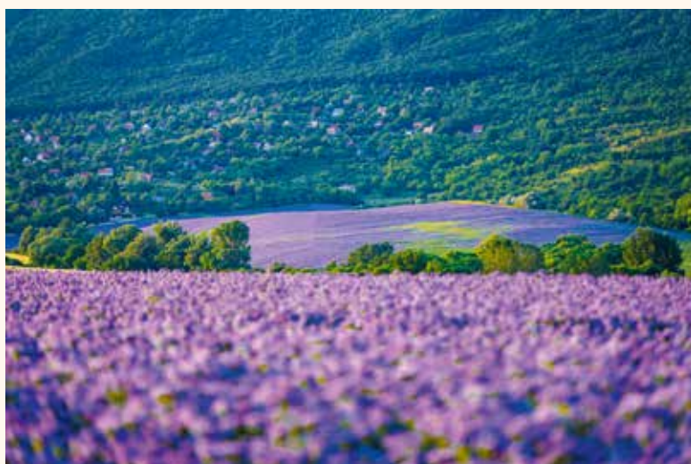
Bármily hihetetlen, ezt a fotót Magyarországon készítette Kévés Andor