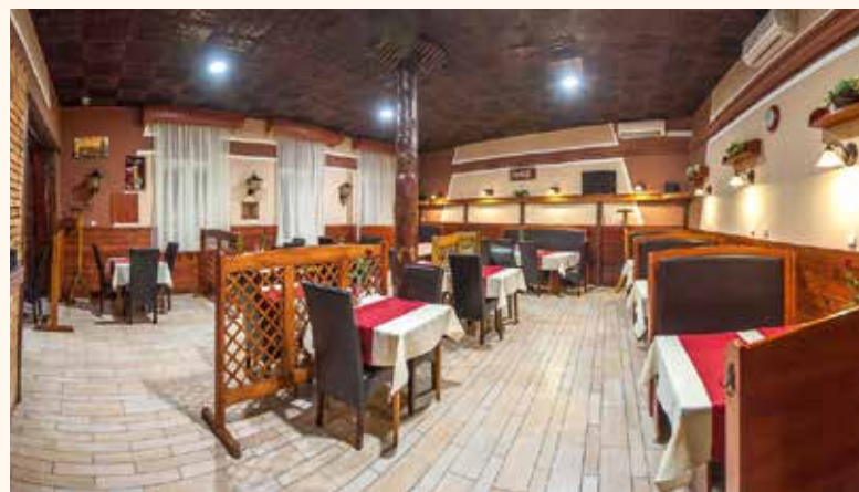
A Venyige étterem ma is hű a nevéhez