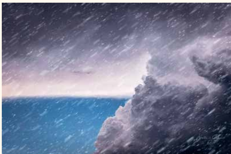
Kovács Gyula viharos fotója nem sziklás tengerpart