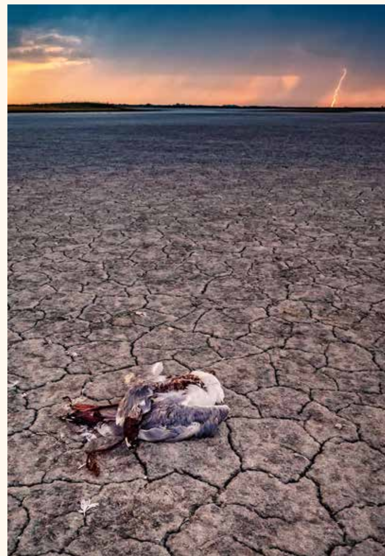
A többszörös nemzetközi díjas Daróczy Csaba különleges látásmódja is kell a képek pazarságához