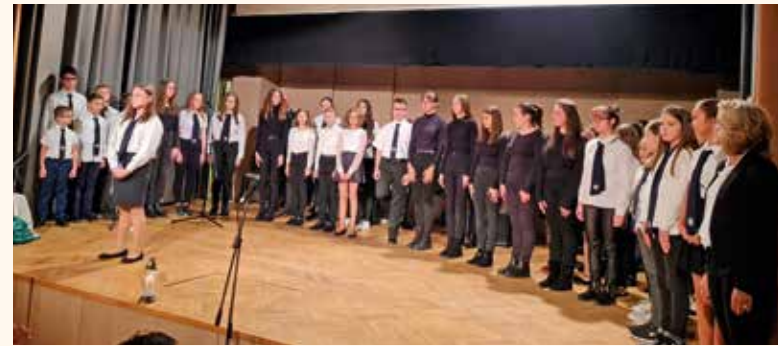
A Kossuth Lajos Evangélikus Iskola diákjai adtak ünnepi műsort

kopjafánál helyezték el a pártok, intézmények, civil szervezetek az emlékezés virágait. Emlékbeszédet mondott Font Sándor országgyűlési képviselő, akit édesapja által sokkal közelebről érintenek meg a 65 évvel ezelőtti események. A politikus leplezetlen meghatottsággal küzdött, részben az 56-os történelem hatása miatt, másrészt Font János bácsi sem érthette meg az ideai nemzeti ünnepet. Nem csak nagyszerű embert, édesapát, nagyapát, dédnagyapát vesztettünk el személyében, de fogynak, szinte elfogynak már a kor, 1956 októberének hiteles tanúi.