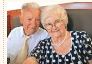
60 éve együtt jóban, rosszban