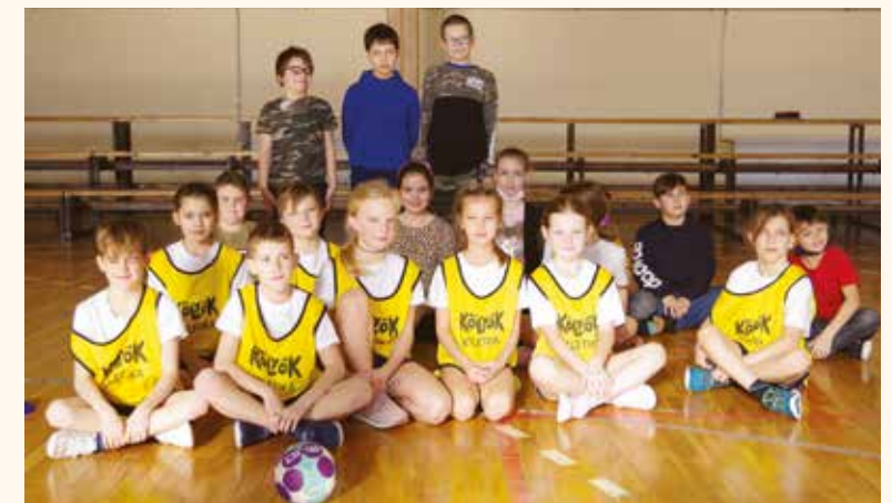
Megosztott első helyezett a C osztály