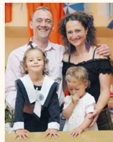
2012. februári címlap