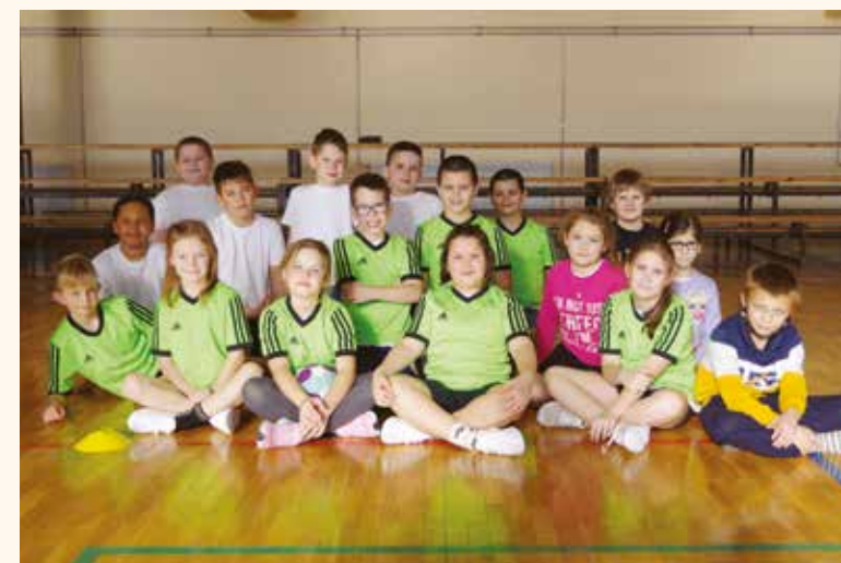
A negyedik helyen zártak a B-sek