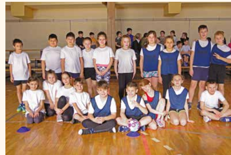
A D osztály csapata bronzéremes lett