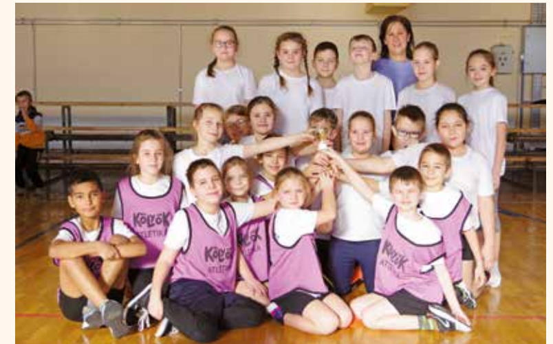
A győztes A osztály csapata