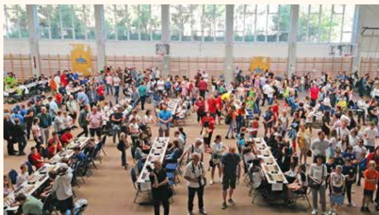
532 sakkozó, több mint 300 kísérő

2022 februárjáig jobbra maszkviseléssel terhelten a csoportos munkában, kiegészítve tevékenységünket az egyéni felkészülésekkel az online térben, de az ilyenkor már mindenképpen megszokott és várt alapozó versenyek nélkül léteztünk. Csupán a műhelymunkák biztosította háttérrel vágtunk neki a diákolimpiai versenysorozatnak: először a kecskeméti megyei csapatdöntőknek (február 12-én), majd rá egy hétre a kiskunfélegyházi korcsoportos egyéni döntőknek. A tét komoly volt: az országos döntőbe jutás, soltvadkertként Bács-Kiskun megye képviselése az országos döntőkön.