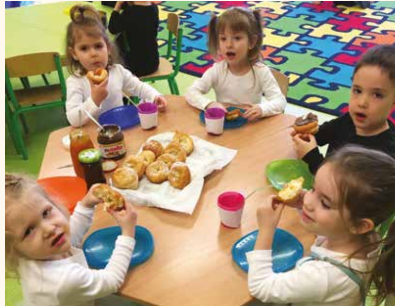
Az evangélikus ovi apró fánkfalói

A tésztájába 1 kanál sütőrumot tesztek (ettől lesz szalagos). Hólyagosra ki kell dagasztani, és kétszer kell visszadagasztani. Majd kiszaggatni, ezután 10 percig hagyni pihentetni, majd forró olajban kisütjük.