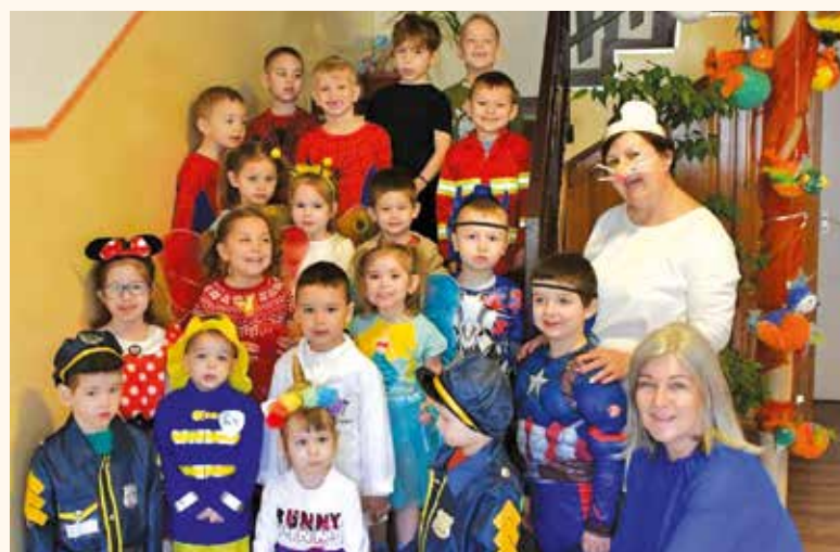
BATMAN, VASEMBER, KIRÁLYLÁNY ÉS MÁSOK A BOCSKAI OVIBAN