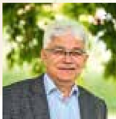
Kedves Soltvadkertiek! Kedves Vendégeink!

2023 különleges esztendő, többszörös ünnepre ad okot.